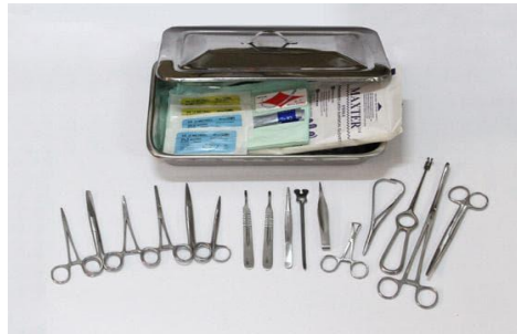
Gambar 1a. Minor set